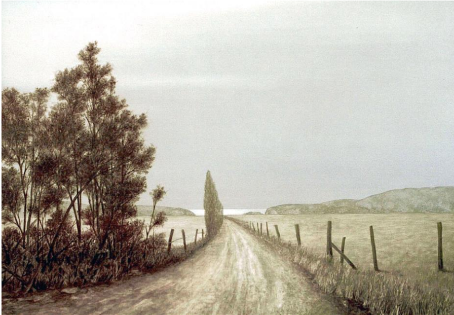
Jürgen Henker Der Weg, 2006 48x57cm 1.600,-Euro