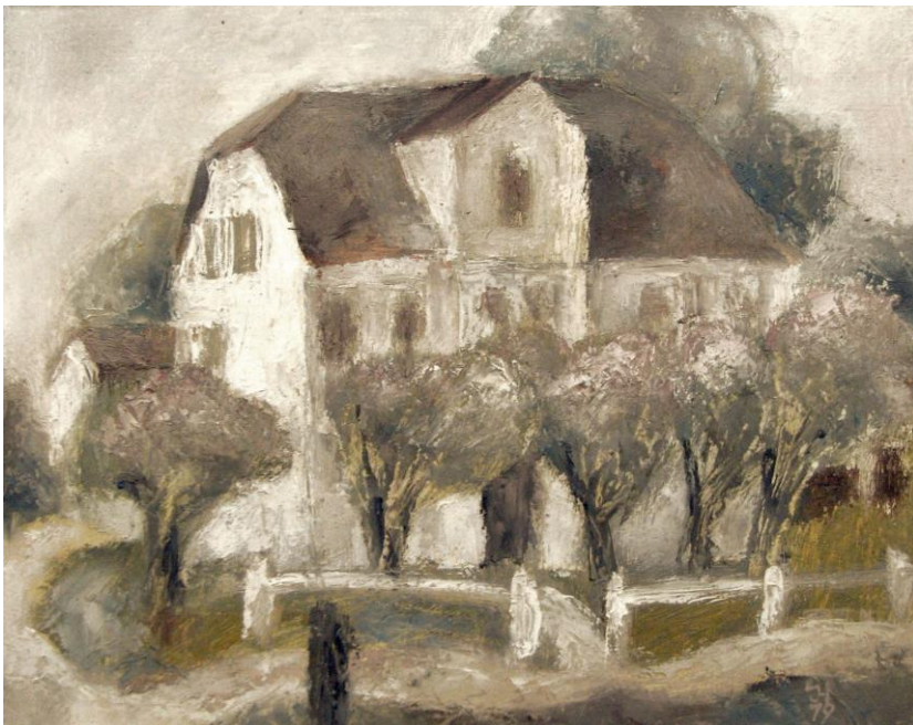
Jürgen Henker Das Fliederhaus, 1979 18x22cm 600,-Euro