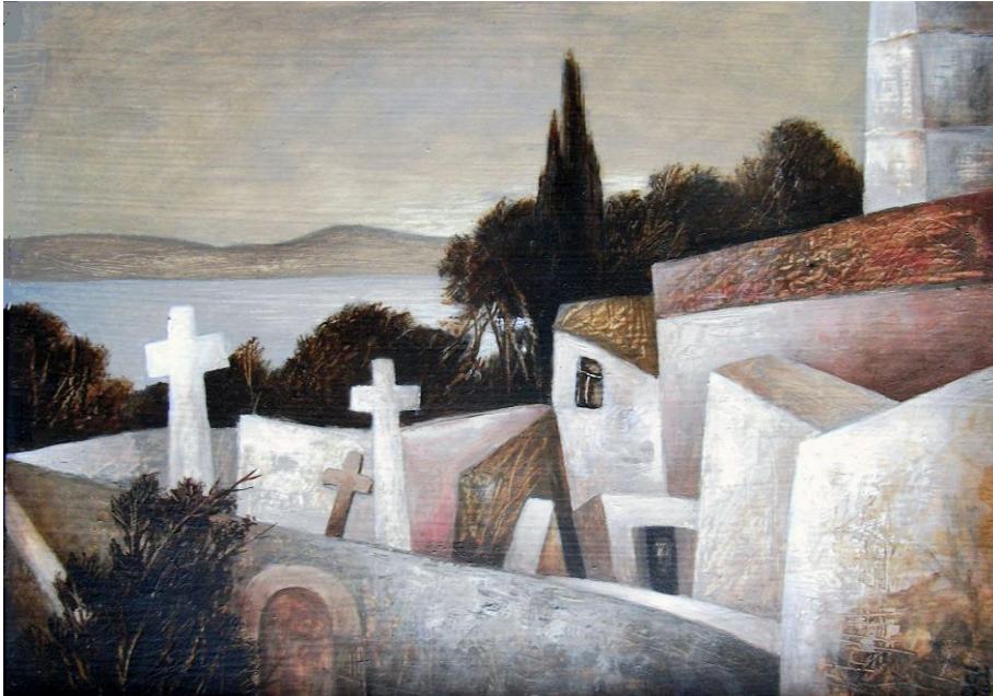
Jürgen Henker Predoscia, 2007 18x24cm 600,-Euro