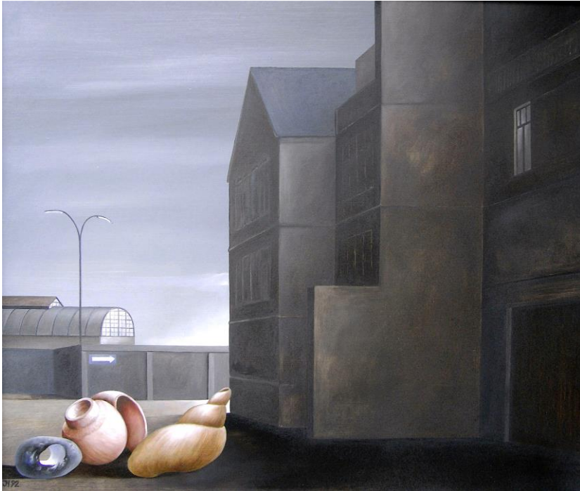
Jürgen Henker Im Schatten der Haus, 1992 48x57cm 1.600,-Euro