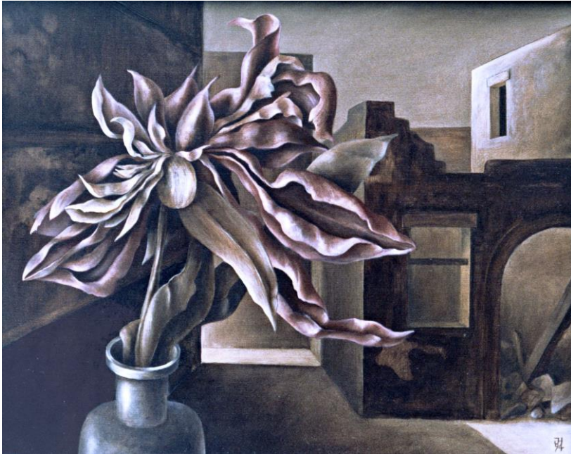
Jürgen Henker Kalidonia, 1994 40x32cm 850,-Euro