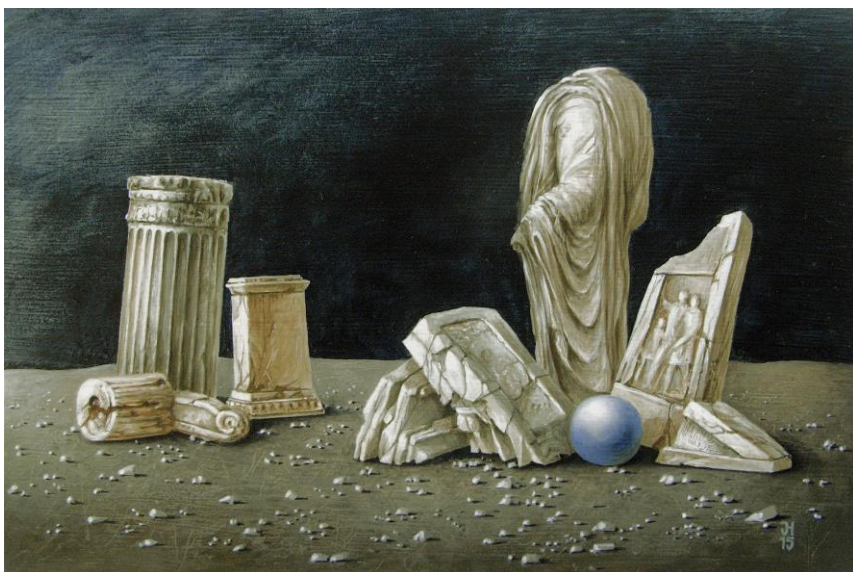
Jürgen Henker Ein Epilog, 2015 20x30cm 800,-Euro