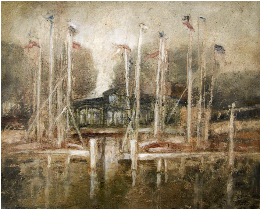
Jürgen Henker Am Zeuthener See, 1983 30x40cm 600,-Euro