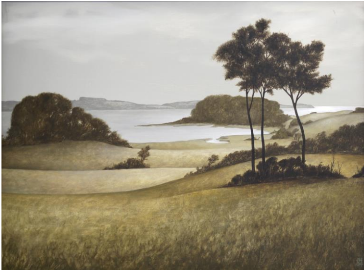
Jürgen Henker Mönchgut (II), 2004 Öl auf Hartfaser 48,5x68cm 1.500,-Euro