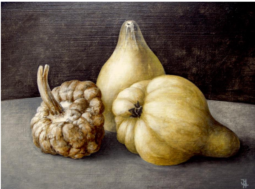
Jürgen Henker Drei Quitten, 2014 18x24cm 650,-Euro