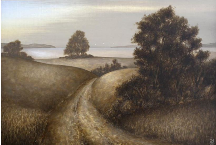
Jürgen Henker Weg nach Liddow, 2005 950,-Euro