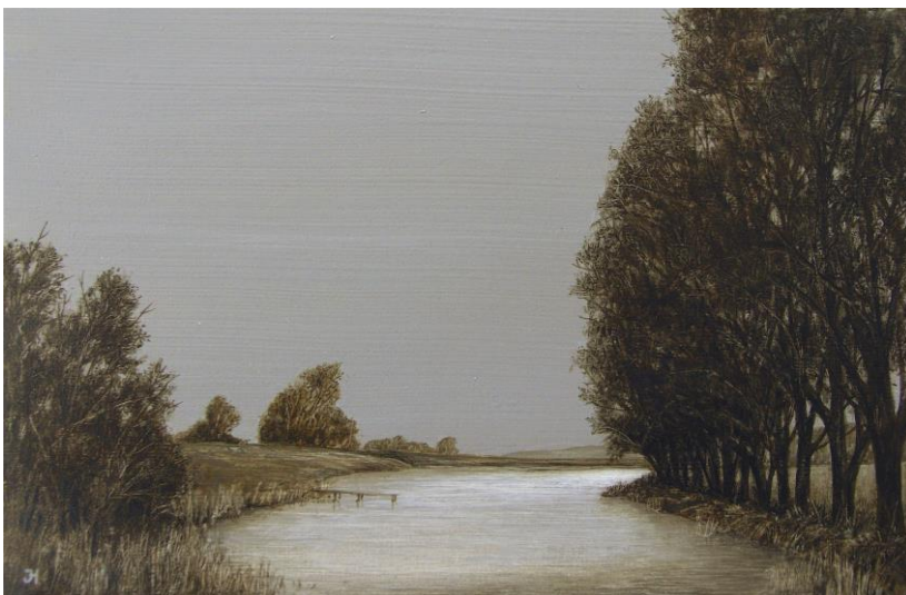
Jürgen Henker Nuthe, 2012 20x30cm 800,-Euro