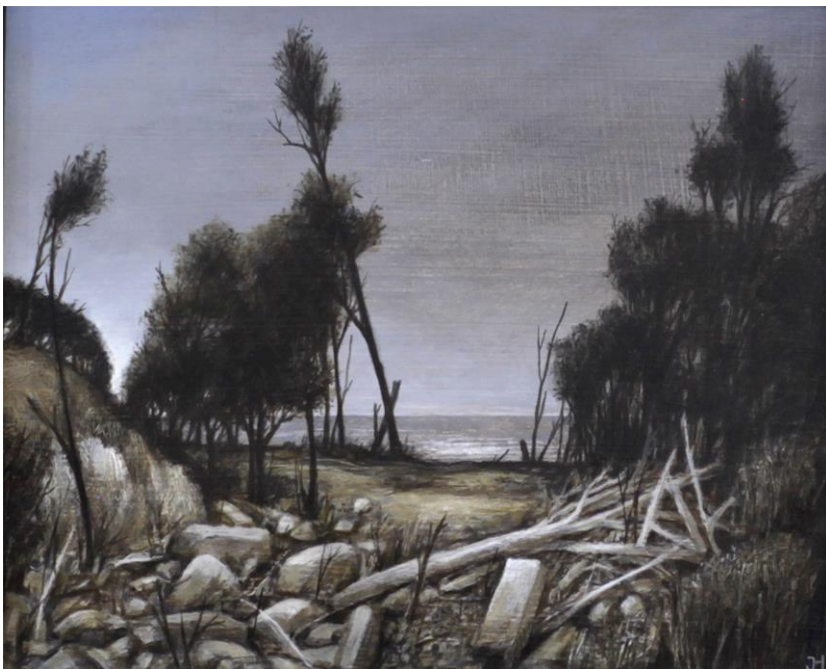
Jürgen Henker Am Hochufer, 2014 650,-Euro