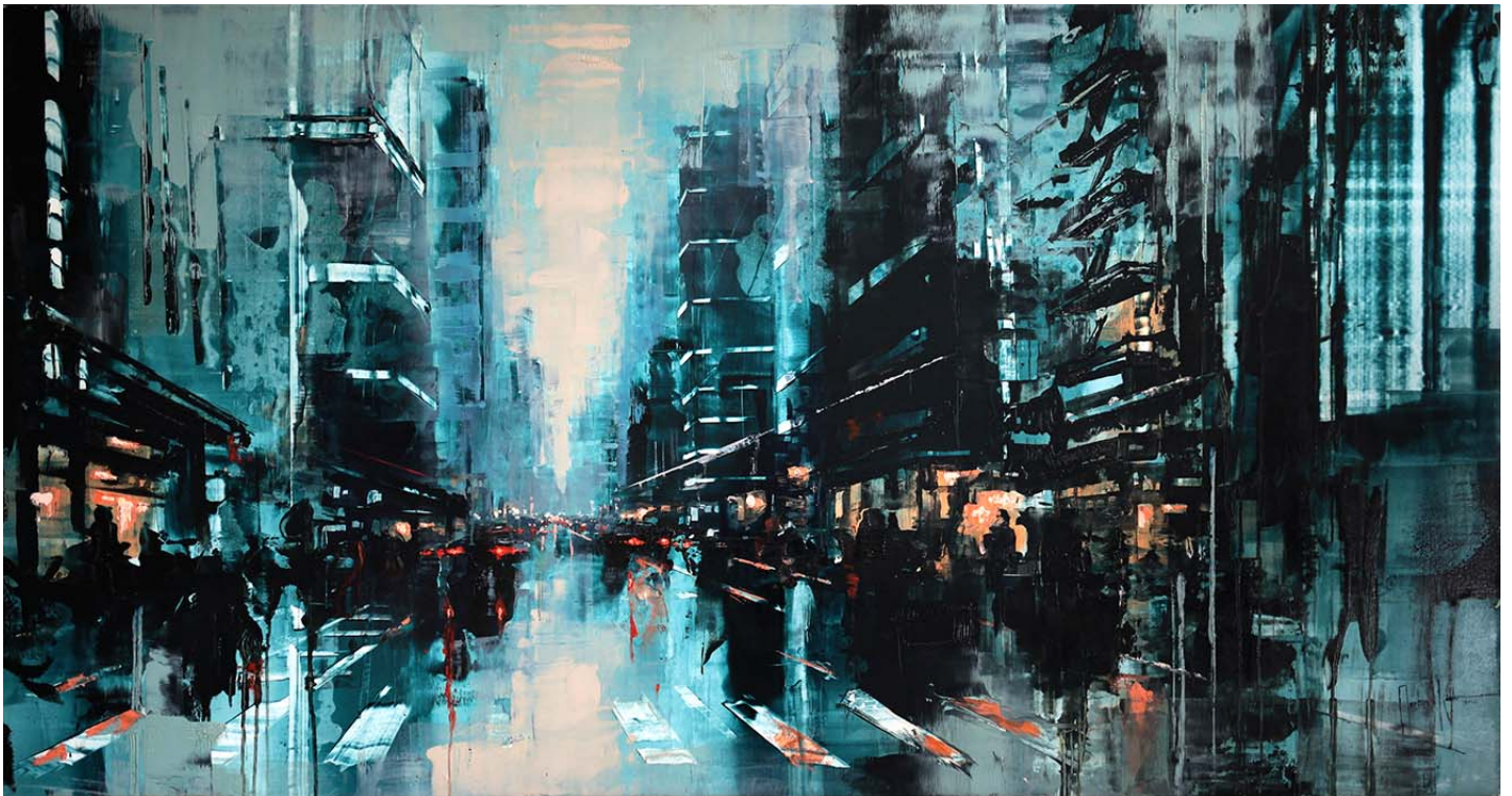
Martin Koester, N.Y. early sun V (fifth avenue), 2020, Öl auf Leinwand, 91x170cm, 6.500,- €