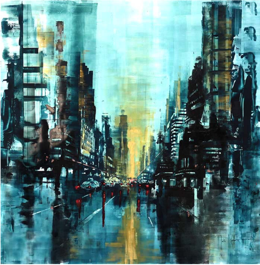
Martin Koester, New York lights IX, 2002, Acryl auf Hartfaser, 92x92cm, 4.900,- €