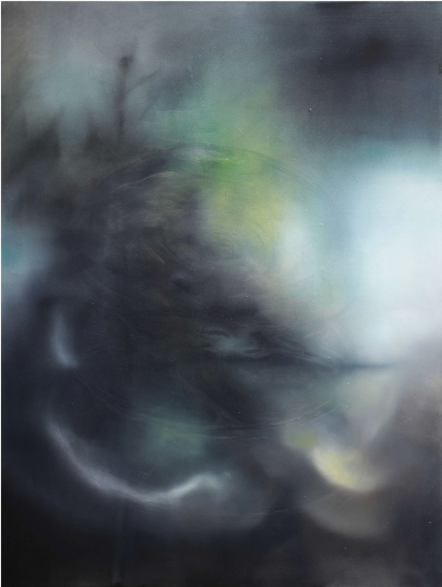
Kerstin Skringer, All Beauty must die IV, 2024, Öl auf Leinwand, 90x70cm, 2.800,- €