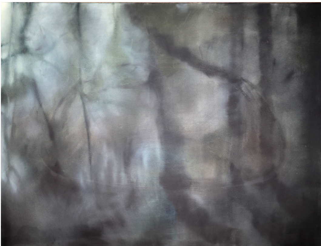
Kerstin Skringer, All beauty must die V, 2024, Öl auf Leinwand, 70x90cm, 2.800,- €